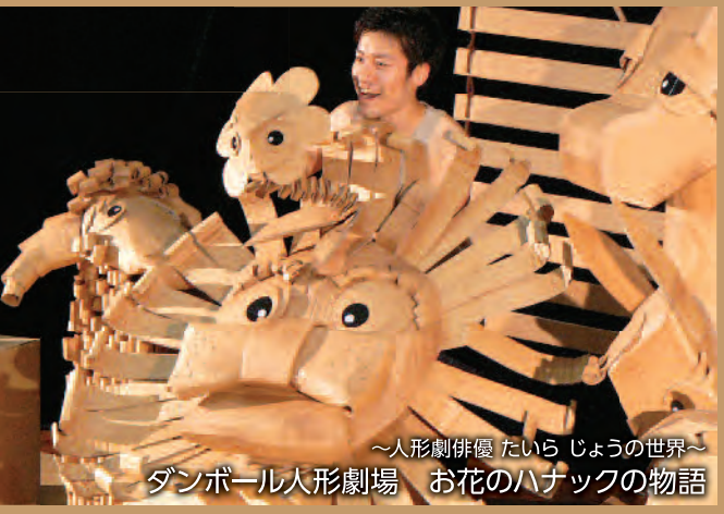
～人形餅屋 たいら じょうの世界～ ダンボール人形劇場 お花のハナツクの物語