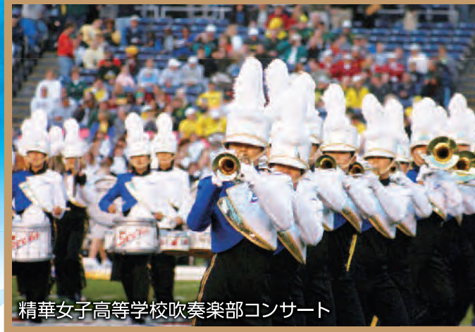
精華女子高等学校吹奏楽部コンサート