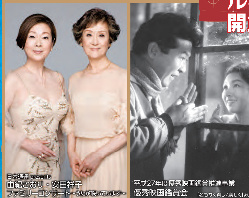
日本通運 presents 由紀さおり・安田祥子 ファミリーコンサート〜うたが咲いています〜