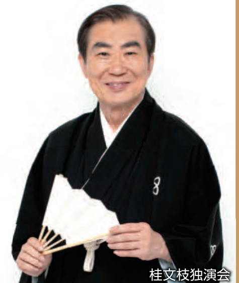
桂文枝独演会 「名もなく貧しく美しく」より