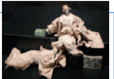
「曾根崎心中 天満屋の段」お初・徳兵衛 ▶